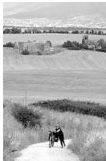
Imagen de Guenduláin.

EL AYUNTAMIENTO DE CIZUR RECURRE EL FALLO DEL TSJN QUE AVALA LA SEGREGACIÓN DEL TERRENO