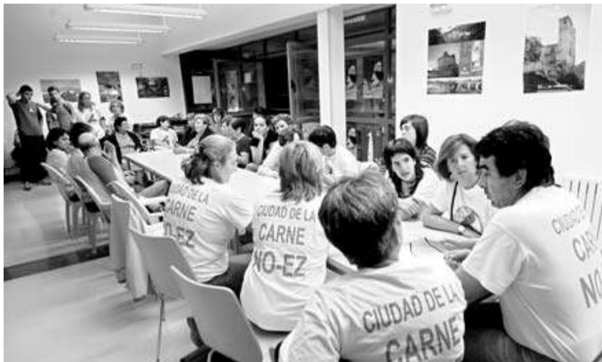
Una reunión de la plataforma Valdizarbe Saludable.