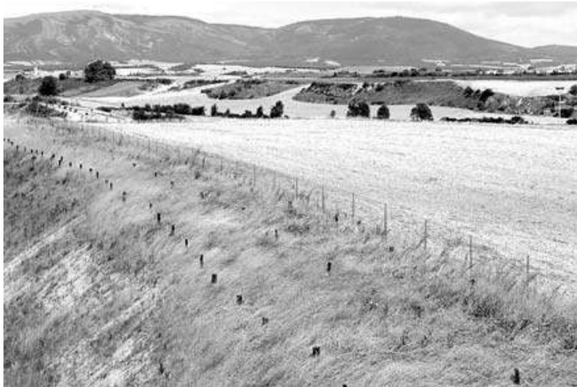
Vista de los terrenos de Legarda donde se ubicará el futuro polígono.